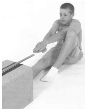
Figure A5-2 Starting Position for the Back-Saver Sit and Reach / Position de départ de la flexion du tronc vers l'avant

g. demander au cadet de répéter les étapes b à f pour l'autre jambe.