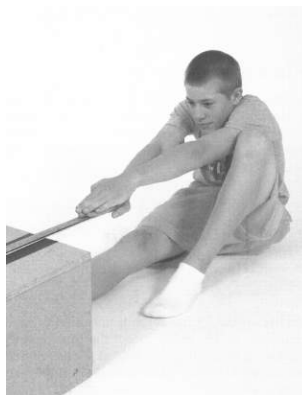
Figure A5-3 The Back Saver Sit and Reach / Exécution de la flexion du tronc vers l'avant

Note. From Fitnessgram / Activitygram: Test Administration Manual (3rd ed.) (p. 92), by The Cooper Institute, 2005, Windsor, ON: Human Kinetics. Copyright 2005 by The Cooper Institute. / Remarque : Tiré de Fitnessgram/Activitygram: Test Administration Manual (3rd ed.) (p. 92), par The Cooper Institute, 2005, Windsor, Ont. : Human Kinetics. Copyright 2005 The Cooper Institute.